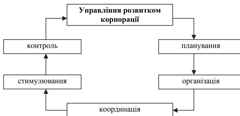
Рис.1 – Цикл управління як процес взаємозв'язаних функцій

сів і керованих об'єктів. Реалізація функцій управління - це цикл управління як процес взаємозв'язаних функцій (рис. 1).