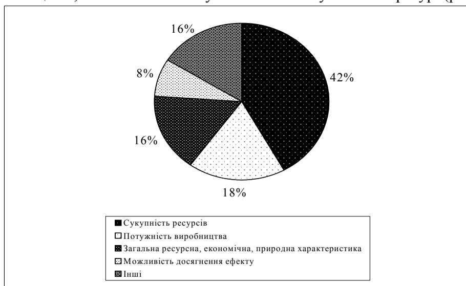
Рис.1. Класифікація ознак поняття «потенціал» за Н.Т.Ігнатенко та В.П.Руденко

Цікавою щодо цього є запропонована Н. Т. Ігнатенком та В. П. Руденком класифікація ознак поняття «потенціал», загальноновживана у вітчизняній науковій літературі (рис. 1.).