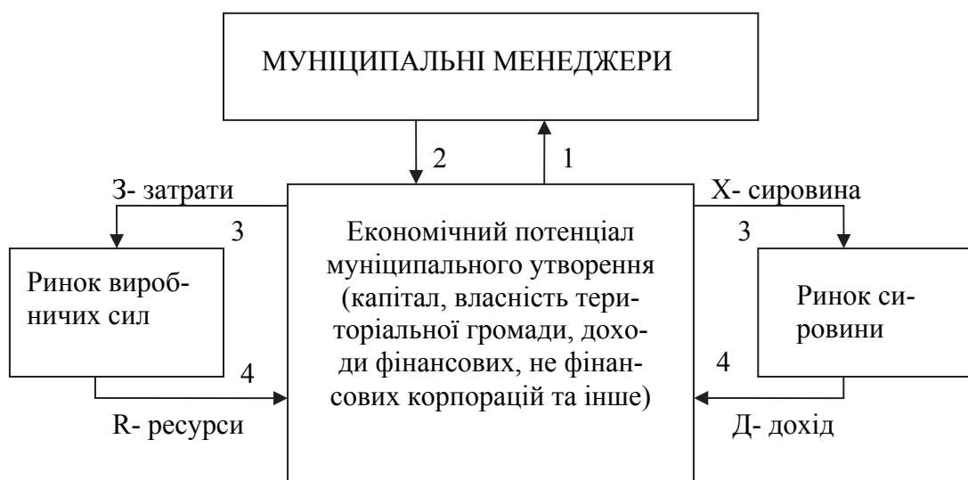
Рис.1. Відтворення економічного потенціалу муніципального утворення

Схематично це можна представити таким чином (рис.1).