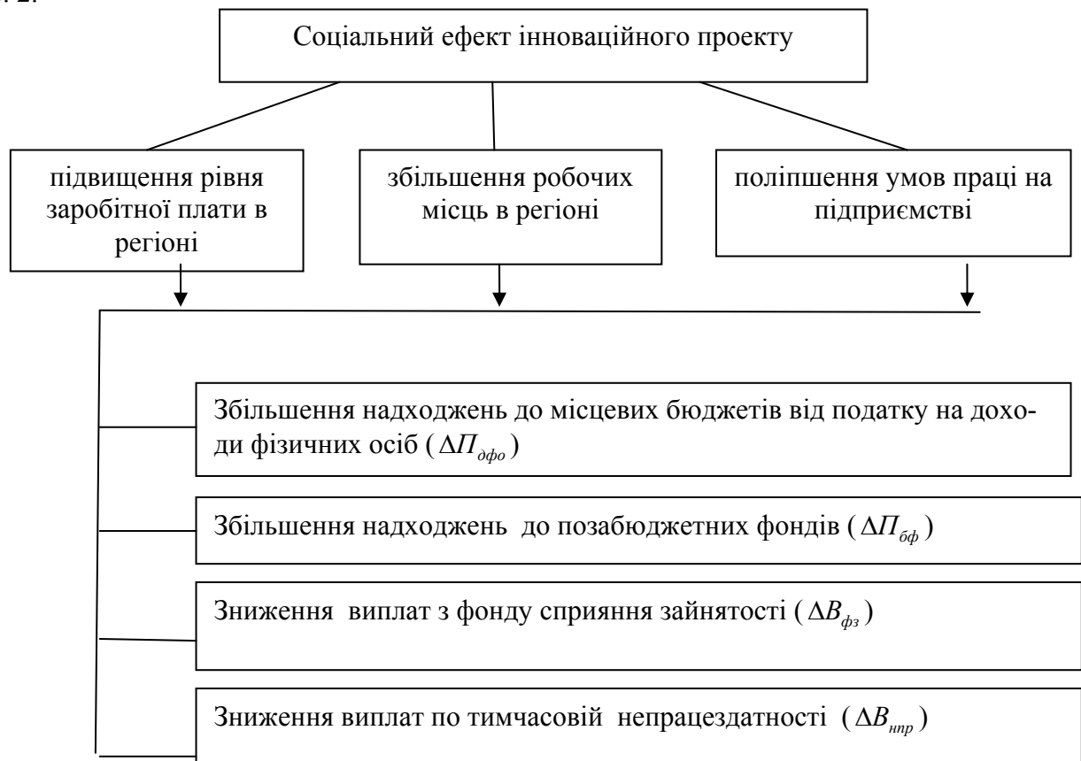
Рис. 2 - Економічні наслідки соціального ефекту інноваційного проекту

Ілюстрація якісних характеристик соціального ефекту інноваційного проекту наведена на рис. 2.