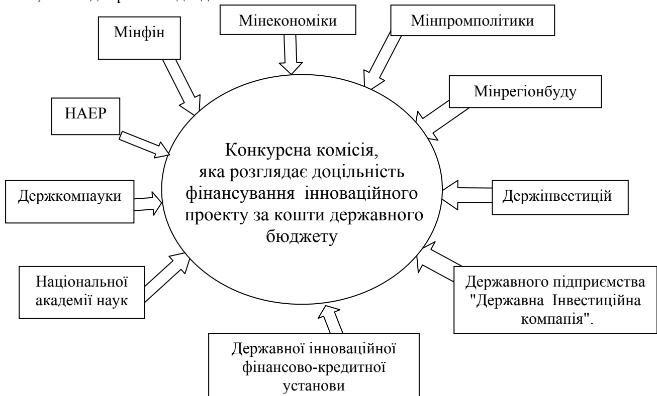
Рис.1 Державні структури, представники яких, згідно з Законодавством України, повинні обов'язково входити до комісії, що розглядає доцільність фінансування інноваційного проекту за кошти державного бюджету

Тобто, практично відсутні дослідження, присвячені визначенню взаємозв'язку між економічним ефектом, який отримує той чи інший розпорядник фінансових ресурсів та його участю у фінансуванні відповідного інноваційного проекту, або інноваційної програми. У зв'язку з цим у якості інвестора розглядається підприємство - інноватор, яке і фінансує інноваційний проект за рахунок власних, позикових коштів або коштів, що надходять у вигляді субсидій з державного бюджету. Останнє є проблематичним як з точки зору дефіциту бюджетних коштів, так і з точки зору організаційних аспектів отримання бюджетних ресурсів: достатньо зазначити, що, згідно з існуючим законодавством [3], для отримання бюджетних коштів підприємство - інноватор повинно отримати дозвіл комісії, у яку входять представники 10 міністерств та відомств (рис. 1). Тому, як свідчать офіційні дані Держкомстату України [4], підприємства за останні десять років при інвестуванні у власне виробництво використовували, в основному власні фінансові ресурси (їх частка у загальному обсязі інвестицій складала від 37 до 65 відсотків), при цьому частка коштів, отриманих з бюджету (державного та місцевого) складала від 0,2 до 2,4 %, кошти іноземних інвесторів складала 0,8 – 24% , а інші джерела - від 5 до 31%.