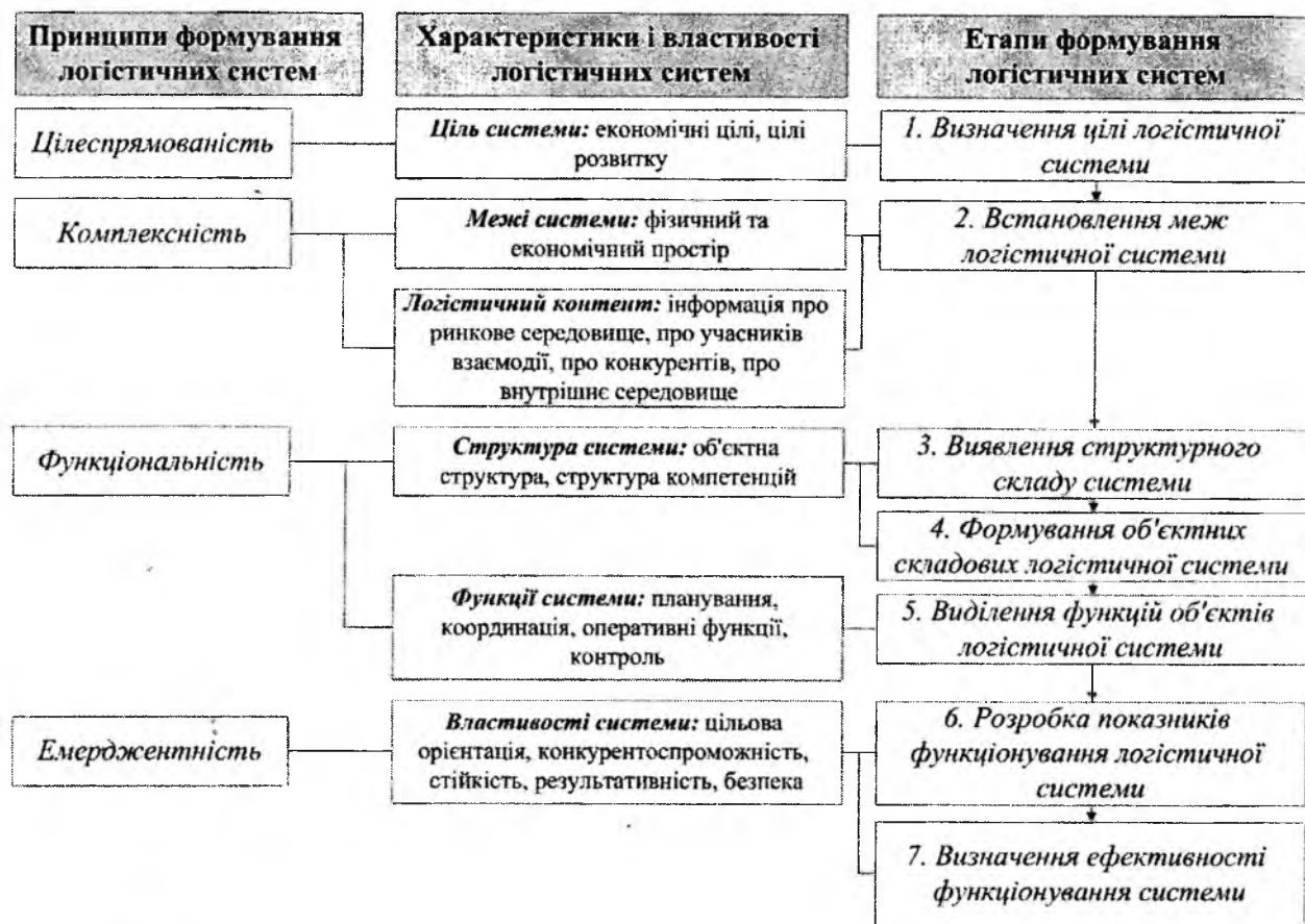
Рис. 1. Взаємозв'язок принципів, характеристик і етапів формування логістичних систем

З динамічністю розвитку ринкових відносин і ускладненням управління соціально-економічними процесами об'єктивно з'являється необхідність у встановленні тривалих відносин між учасниками економічної діяльності, що зумовило появу сітьової форми організації логістичної діяльності [7]. Проявом сітьового підходу в логістиці є активізація діяльності в економіці по формуванню логістичних сітей.