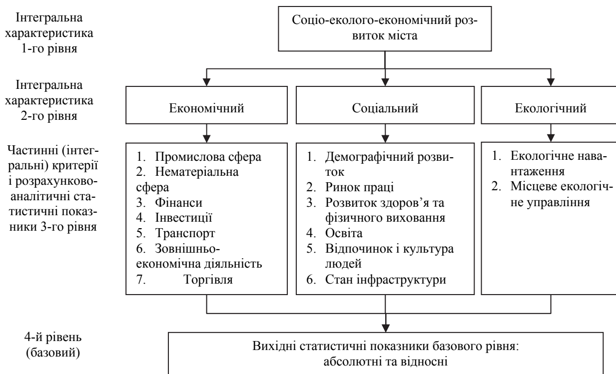
Рис. 1. Ієрархічна система статистичних показників, частинних критеріїв і інтегральних індикаторів соціо-еколого-економічного розвитку міста

На рис. 1 представлена загальна схема ієрархічної системи критеріїв та статистичних показників.