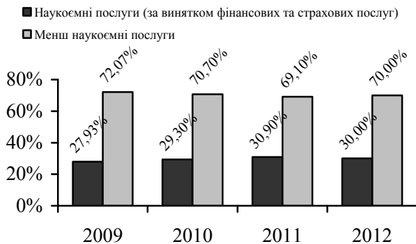
Рис. 2. Динаміка наукоємних послуг в Україні. Розраховано автором за [8; 9]

Відповідно до наведеної класифікації нами було розраховано рівень наукоємності реалізованих послуг в українській економіці та представлено динаміку даного показника за період 2009–2012 рр. (Рис. 2).