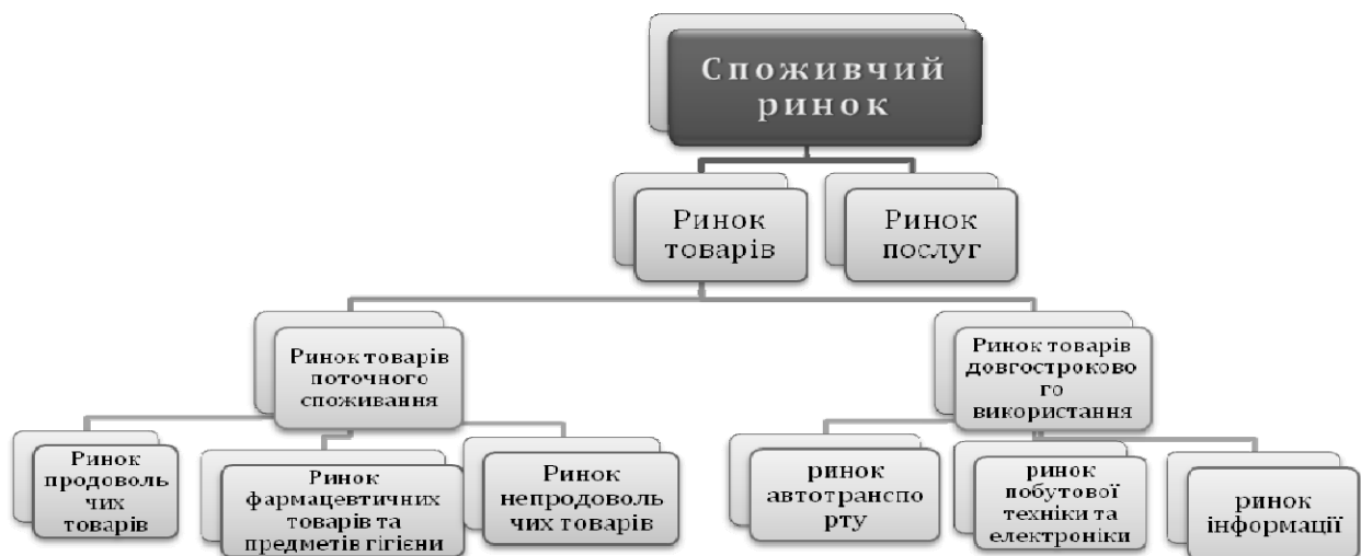
Рис. 1. Структура споживчого ринку

На наш погляд, для аналізу тенденції розвитку і функціонування ринку споживчих товарів доцільно виокремити ринок товарів поточного споживання та ринок товарів довгострокового використання. Така класифікація споживчого ринку дозволяє аналізувати не тільки кругообіг товарів в цілому, а й за терміном споживання, а також досліджувати вплив споживчого попиту на розвиток галузей національної економіки (рис.1).