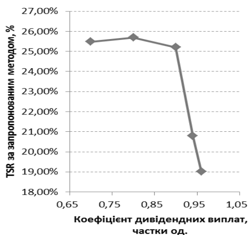
Рис.2. Графік залежності TSR по інвестиційному проекту розвитку ПАТ «ПівнГЗК» від коефіцієнту дивідендних виплат

Слід зазначити, що при K_{див} \leq 0,80 підприємству не потрібно залучати банківські кредити, тому оптимальний K_{див} не може бути нижчий 0,80. Як видно з рис. 3, при зниженні кредитної ставки лінія залежності TSR від коефіцієнту дивідендних виплат зміщується вправо, починаючи з K_{див}=0,80 . Тобто у разі зниження кредитної ставки темпи зниження TSR уповільнюються та оптимальний K_{див} збільшується до 0,90.