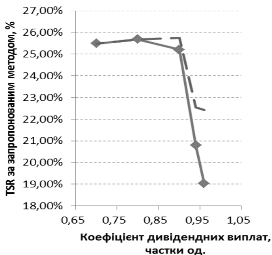
Рис. 3. Зміщення вправо лінії залежності TSR від коефіцієнту дивідендних виплат при зниженні кредитної ставки по інвестиційному проекту розвитку ПАТ «ПівнГЗК»

Слід зазначити, що при K_{див} \leq 0,80 підприємству не потрібно залучати банківські кредити, тому оптимальний K_{див} не може бути нижчий 0,80. Як видно з рис. 3, при зниженні кредитної ставки лінія залежності TSR від коефіцієнту дивідендних виплат зміщується вправо, починаючи з K_{див}=0,80 . Тобто у разі зниження кредитної ставки темпи зниження TSR уповільнюються та оптимальний K_{див} збільшується до 0,90.