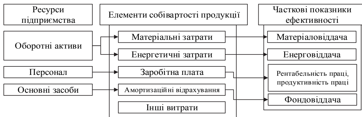
Рис. 2. Взаємозв'язок собівартості продукції з ресурсами підприємства

Взаємозв'язок собівартості продукції з ресурсами підприємства визначено на рис. 2.