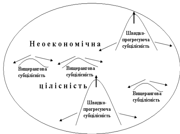
Рис. 2. Новоекономічний ландшафт доби початку занепаду традиційного суспільства

в неоекономічному поступі. Тож кластерам нової економіки, зануреним у суцільне навколишнє середовище традиційного, було важко розвиватись так швидко, аби, наздоганяючи, зрівняти ці відмінності. Проте це означає стале закріплення за окремими кластерами статусу лідерів. Лідери неоекономічного поступу Середньовіччя в цю епоху поступово втрачають подібний статус. Аналогічні процеси відбулися стосовно і староекономічного, але із значним лагом. Так, Китай, один з економічних і неоекономічних провідників у ранньому середньовіччі, почавши втрачати лідируючі позиції в новій економіці з XIV ст. та ставши неоекономічним аутсайдером ще в часи Ренесансу, позбавився аналогічних позицій в економічній царині лише у середині XIX століття [8, с. 62–63].