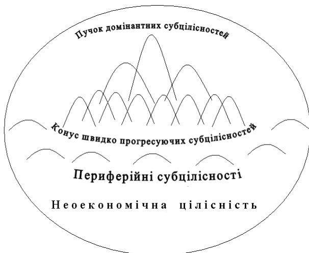
Рис. 3. Новоекономічний ландшафт доби промислового перевороту та індустріалізації

Подальша деградація останнього на окремих територіях, посилення ролі та потужності нової економіки у відповідних економічних локалізаціях, стрімкий ранговий прогрес одних субцілісностей при спокій інших обумовили формування пучка домінуючих субцілісностей. Вони розташувались на вістрі конусу нижчих за рангом, але прогресуючих згущень неоекономічного. Інші ж, порівняно відсталі субцілісності нової економіки, утворювали периферію неоекономічної цілісності.