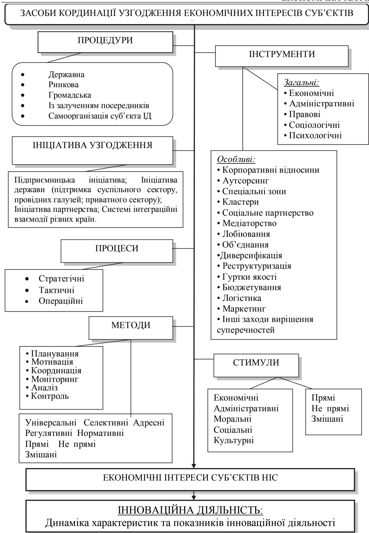
Рис.2. Засоби координації узгодження економічних інтересів суб'єктів НІС.