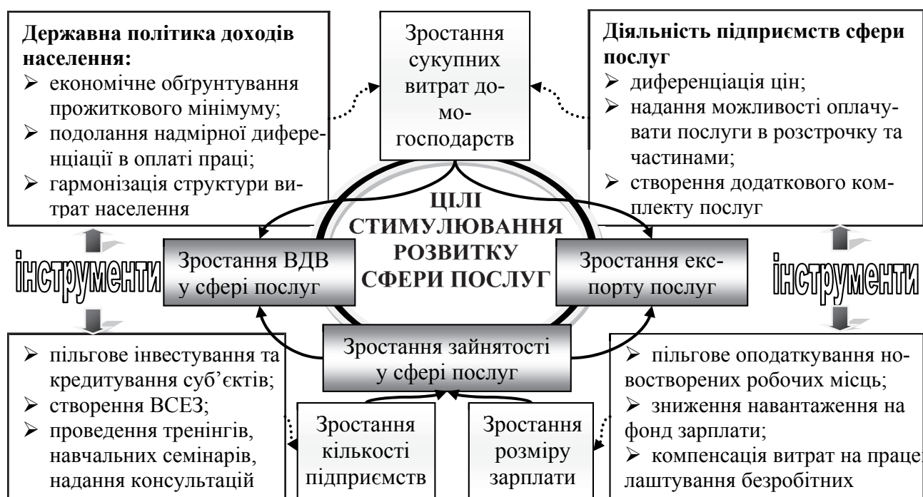
Рис. 1. Взаємозв'язок між цілями та інструментами механізму стимулювання розвитку сфери послуг в Україні.

Найбільш складним та важливим елементом механізму є четвертий елемент, який передбачає вибір інструментів для реалізації цілей стимулювання. Для більшої наочності та спрощення викладення матеріалу представимо систему цілей та інструментів на рисунку 1.