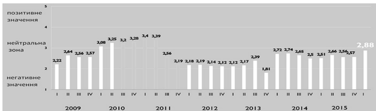
Рис. 1. Індекс інвестиційної привабливості

Аналіз відповідей 92 керівників членських компаній асоціації показав, що 78% директорів компаній не задоволені станом інвестиційного клімату країни. Основними причинами цього є нульовий темп реформ, відсутність системних зрушень та прояви корупції на всіх рівнях. Позитивно оцінили стан інвест-клімату тільки 11% респондентів, за рахунок певної стабілізації курсу національної валюти. А доля респондентів, які сказали, що в країні не відбулось позитивних змін, знизилась з 60 до 50%.