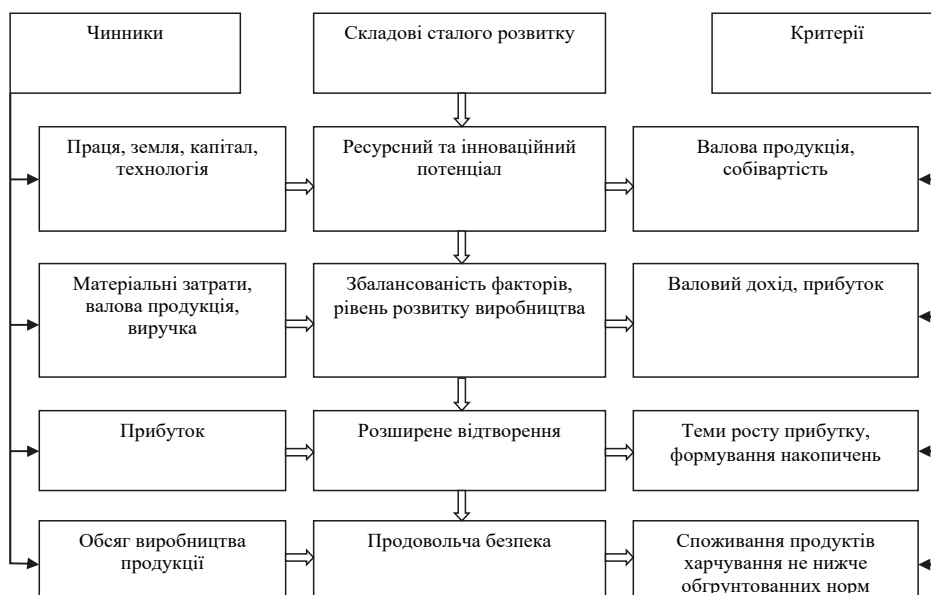
Рис. 2. Зміст складових сталого розвитку сільськогосподарського виробництва [9, с. 7]

У ринкових умовах основними факторами впливу на сталий розвиток сільськогосподарського виробництва є витрати, ціна, прибуток товаровиробників. Неврегульованість відносин на агропродовольчому ринку, випередження темпів росту продовольчої інфляції відносно загального рівня інфляції, зумовлюють зниження реальних ресурсів населення. При цьому ціни реалізації сільськогосподарських товаровиробників значно нижче роздрібних цін на аграрну продукцію і продовольство [10, с.139]. У зв'язку із цим, необхідно забезпечити стабілізацію кон'юнктури сільськогосподарської продукції, якої можна досягти формуванням ринкових запасів, що дозволять у періоди росту попиту на аграрну продукцію здійснити реалізацію за реальними цінами. При цьому особливого значення набувають державні інструменти регулювання через товарно-закупівельні інтервенції на ринку з метою забезпечення стабільних цін та умов сталого розвитку сільськогосподарського виробництва.