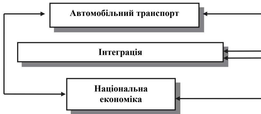
Рис. 3. Детермінанти сучасного розвитку автомобільного транспорту України

ські перевезення, забезпечуючи виконання потреб держави та суспільства у перевезеннях та, приєднуючись до європейських транспортних систем, сприяє міжнародній інтеграції національної економіки (рис. 3).