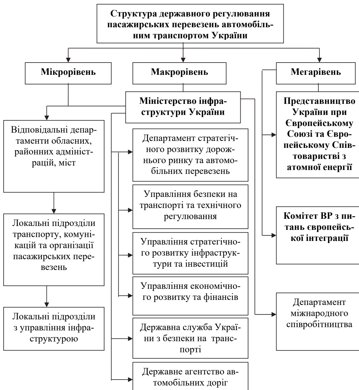
Рис. 2. Структура державного регулювання пасажирських перевезень автомобільним транспортом України

а відтак і реструктуризація системи державного регулювання автомобільного транспорту мала б стати одними з першочергових завдань державної політики. В іншому випадку, Україні не вдасться у повному обсязі реалізувати стратегічні цілі розвитку автомобільного транспорту у короткостроковій, середньостроковій та довгостроковій перспективах.