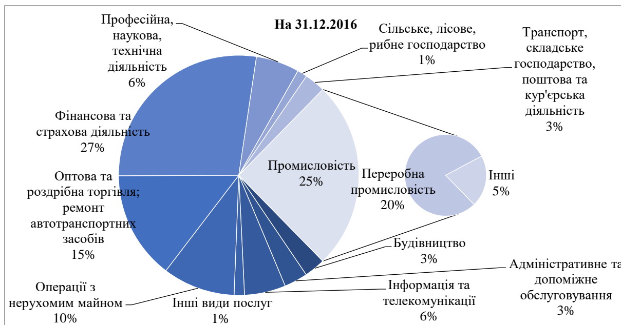
Рисунок 2. Структура ПІІ в економіці України за видами економічної діяльності, 2016 р.

Проаналізуємо галузі української економіки, що є найбільш привабливими з точки зору іноземних інвесторів (рис.2.). Для держави у цілому важливо, щоб кошти направлялися в інноваційні промислові виробництва, які на сьогоднішній день є основою ефективного розвитку будь-якої економіки світу.