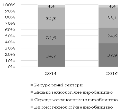
Рис. 2. Технологічна структура переробної промисловості України за Стандартною міжнародною торговельною класифікацією (СМТК) ООН у 2014 і 2016 рр., %

Сформовані передумови не сумісні з розвитком високотехнологічних галузей виробництва, де перманентні інвестиції в інновації є невід'ємним чинником розширеного відтворення. За оцінками ЮНІДО, частка виробництв у структурі переробної промисловості, які належать до високотехнологічних (фармацевтичні препарати і медичне обладнання, парові турбіни, оснащення з генерації електричної енергії, продукція авіакосмічної галузі, телекомунікаційне обладнання, електричне устаткування, комп'ютерна техніка, оптичні прилади тощо), у 2014–2016 рр. в Україні склала 4,4% (рис. 2).