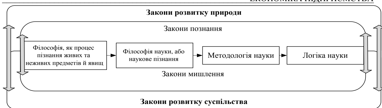
Рис. 1. Революційний розвиток методології наукового пізнання

Головним результатом третьої наукової революції стало виникнення постнеокласичної науки. Вона перетворилась у технологічну революцію, яка сформувала постіндустріальну цивілізацію. Їй відповідає постіндустріальне, інформаційне, постмодерне суспільство [6]. Основою цього суспільства стали новітні технології, які ґрунтуються на нових джерелах і видах енергії, нових матеріалах і засобах управління технологічними процесами. Виняткову роль в цьому відіграє цифровізація всіх рівнів управління, засоби масової комунікації, інформатики й кібернетики. Постнеокласична наука відчуває посилення впливу зовнішніх факторів, більше долучається до культури історичної епохи з її світоглядними установками, релігійними, моральними, естетичними ціннісними орієнтаціями тощо [6].