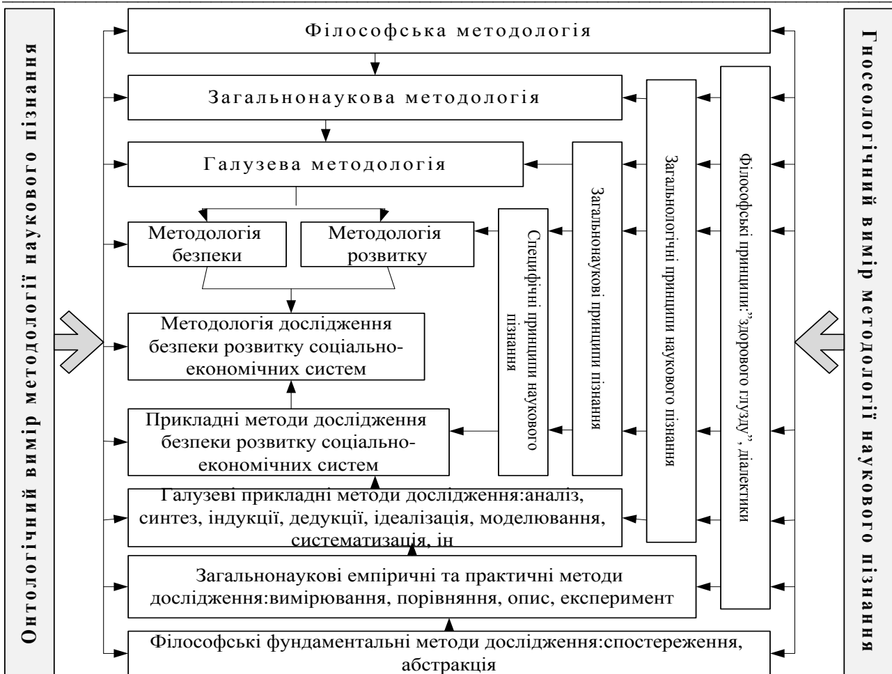
Рис. 2. Ієрархія методології дослідження безпеки розвитку підприємств

Філософські принципи можна поділити на два напрями, один з яких, є Декартові принципи «здорового глузду», орієнтовані на розвиток наукової методології. Основними з них вважають [6]: