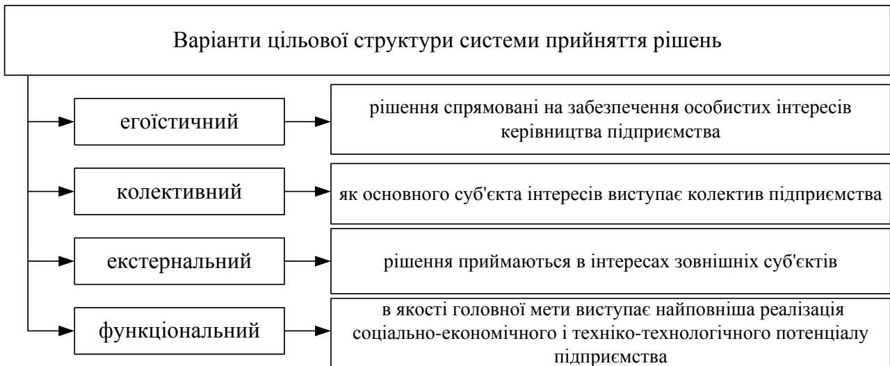
Рис. 3. Варіанти цільової структури системи прийняття рішень

льової структури системи прийняття рішень, що наведено на рис.3.