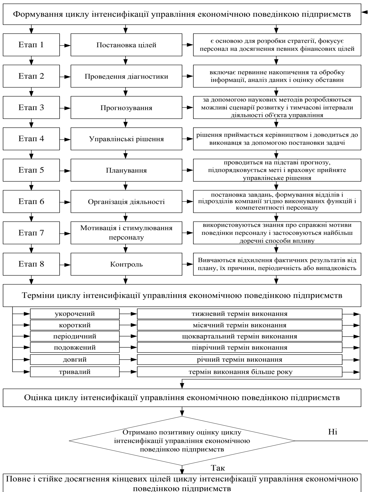
Рис. 3. Сучасний науково-практичний підхід до оцінки інтенсифікації циклів управління економічною поведінкою підприємств

Етап планування проводиться на підставі прогнозу, підпорядковується меті і