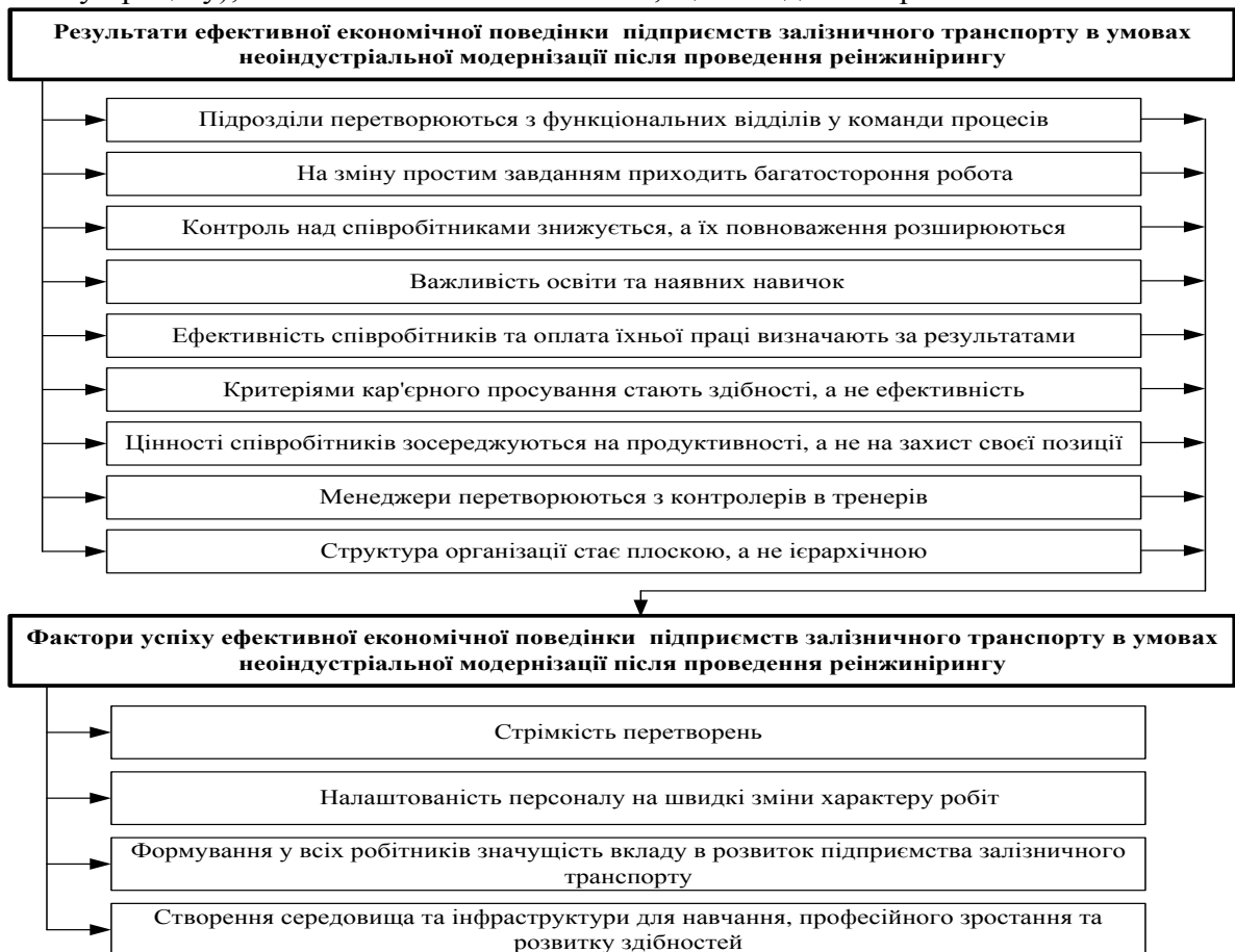
Рис. 2. Результати ефективної економічної поведінки підприємств залізничного транспорту в умовах неоіндустріальної модернізації після проведення реінжинірингу

Все це є основою формування концептуально-поведінкових основ інтенсифікації управління промисловими підприємствами залізничного транспорту в умовах неоіндустріальної модернізації, що є підґрунтям до підвищення рівня їх ефективної діяльності та розвитку за допомогою інструментів реінжинірингу. При ефективно створеній економічній поведінки підприємств залізничного транспорту в умовах неоіндустріальної модернізації після проведення реінжинірингу можливо отримати наступні результати, що наведено на рис. 2.