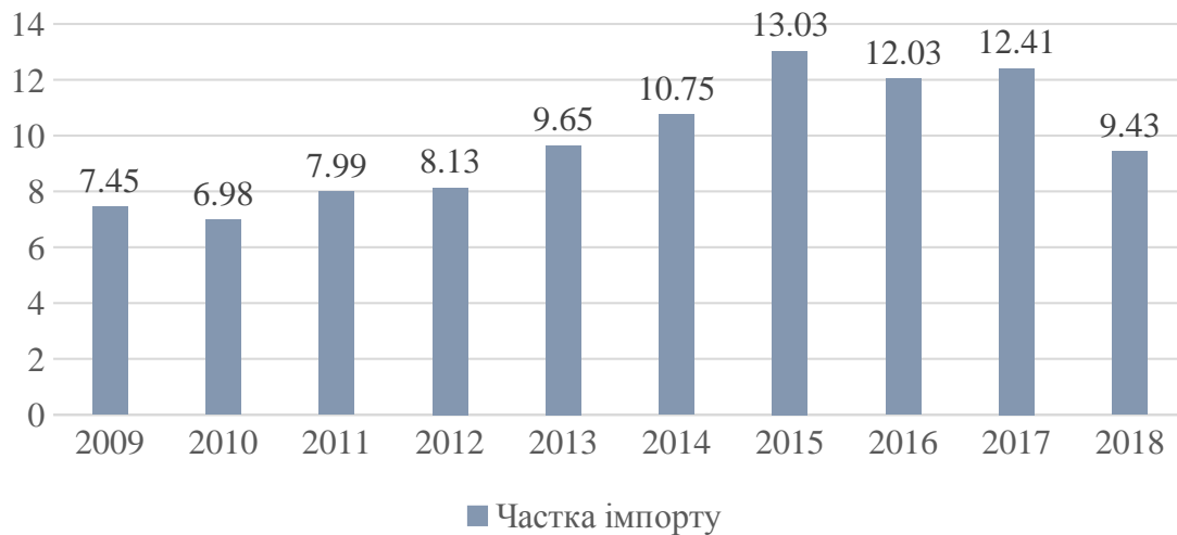
Рис. 2. Частка імпорту України до країн Центральної Європи у загальному обсязі імпорту країни у 2009–2018 роках, %.