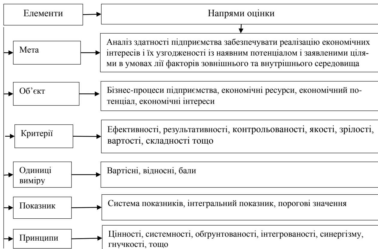
Рис. 1. Основні елементи системи оцінки економічної безпеки [5].

(суб'єкта господарської діяльності, що використовує (виходи) бізнес-процесів) та з огляду на параметри створювання подібної цінності; таким чином, стан економічної безпеки виникатиме лише в разі досягнення достатнього (бажаного) рівня узгодженості цільової (створювана цінність) та забезпечуючої (сукупність бізнес-процесів) підсистем підприємства» [5]. Тобто, Коптева Г. М. визначає, що оцінка економічної безпеки підприємства має ґрунтуватися на його бізнес-процесах, а не на функціональному підході. З точки зору управління економічною безпекою, не можемо не погодитись з автором [5], оскільки управління є по суті процесною діяльністю. Зауважимо, що дослідження Коптевої Г. М. стосується підприємств торгівлі, проте вважаємо застосування його у інших видах діяльності доцільним, оскільки бізнес-процеси мають важливе значення у будь якій сфері. Тому таке доповнення функціонального підходу дозволить сформулювати комплексну систему оцінки, яка буде враховувати усі аспекти. Елементи системи оцінки економічної безпеки підприємства за підходом бізнес-процесів та основні напрями представлені на рисунку 1.