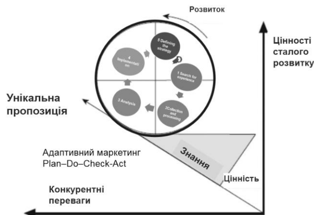
Рис.2. Стратегія бенчмаркінгу

Таким чином, стратегія бенчмаркінгу як конкурентна стратегія послідовника (імітації та адаптації) може стати драйвером безперервного удосконалення практики бізнесу та знаходження інноваційних ідей для набуття конкурентних переваг, з одного боку, та задоволення вимог сталого розвитку, з іншого (див. рис.2).