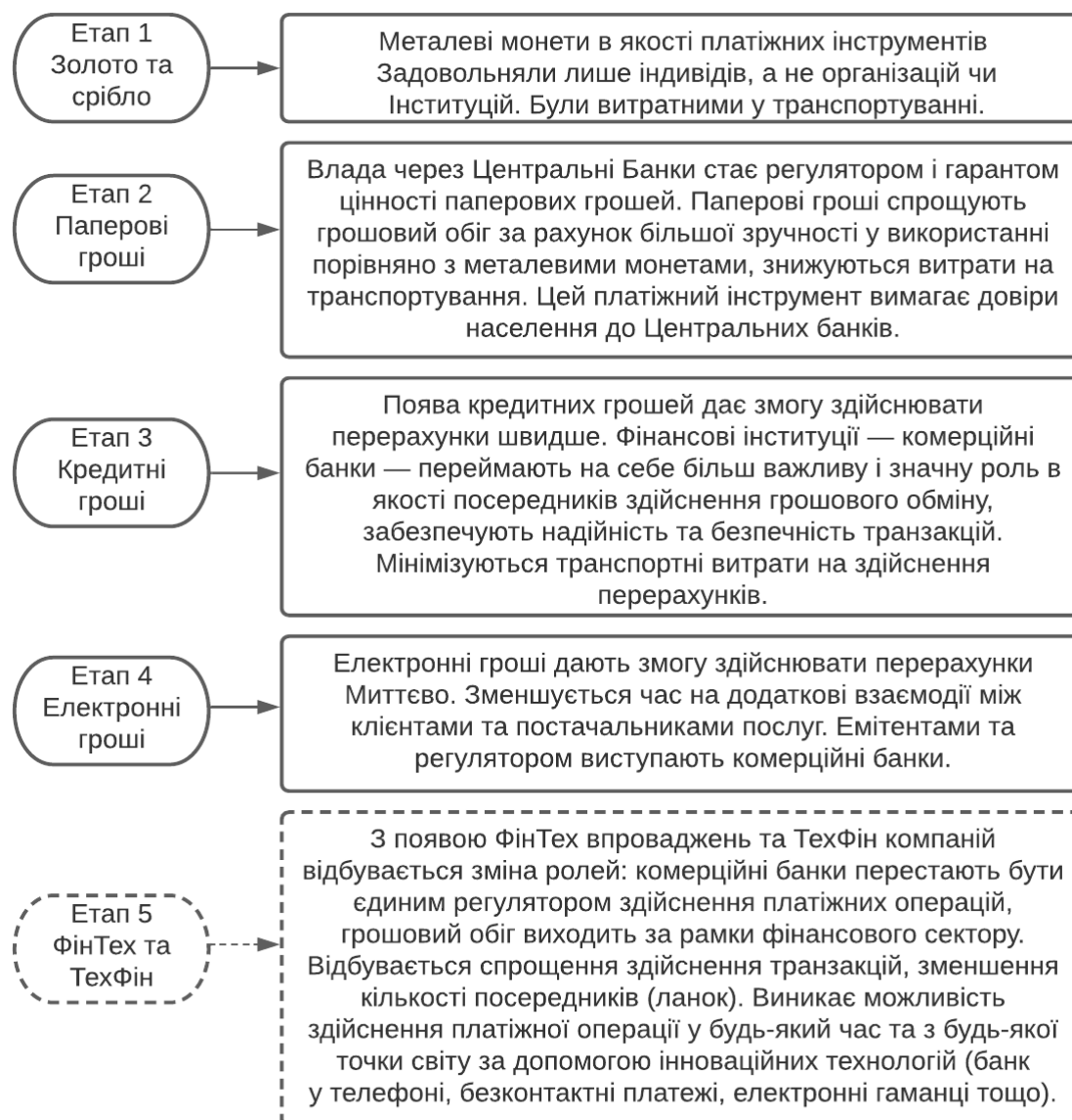
Рис. 1. Еволюція платіжних інструментів як елементів платіжної системи [11]

Сформульовано еволюцію платіжних інструментів як елементів платіжної системи (рис. 1).