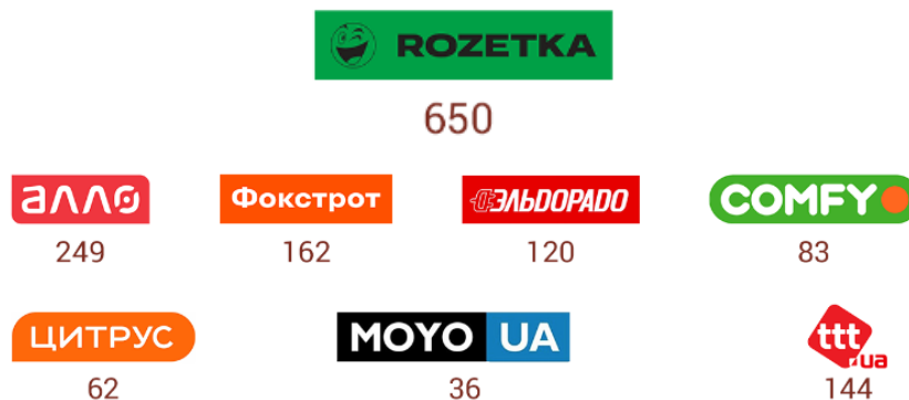
Рис. 1. Найбільші магазини техніки (кількість магазинів), станом на 31.10.2021 р. [1]

Формулювання мети статті. Метою даної статті є висвітлення й удосконалення методичних складових формування цін на товари і послуги компанії Цитрус.