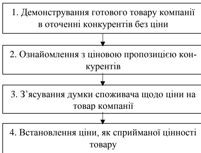
Рис. 4. Метод сприйманої цінності, що базується на кількісному дослідженні готового товару.

Спочатку на етапі 1 споживачеві демонструється готовий товар компанії в оточенні конкурентів без ціни. Далі споживачі ознайомлюються з товарами-конкурентами, що мають цінник з реальною ціною (етап 2). На етапі 3 споживачеві ставиться питання: скільки, на його думку, повинен коштувати товар компанії? Названа ціна і буде сприйманою цінністю товару [12; 13].