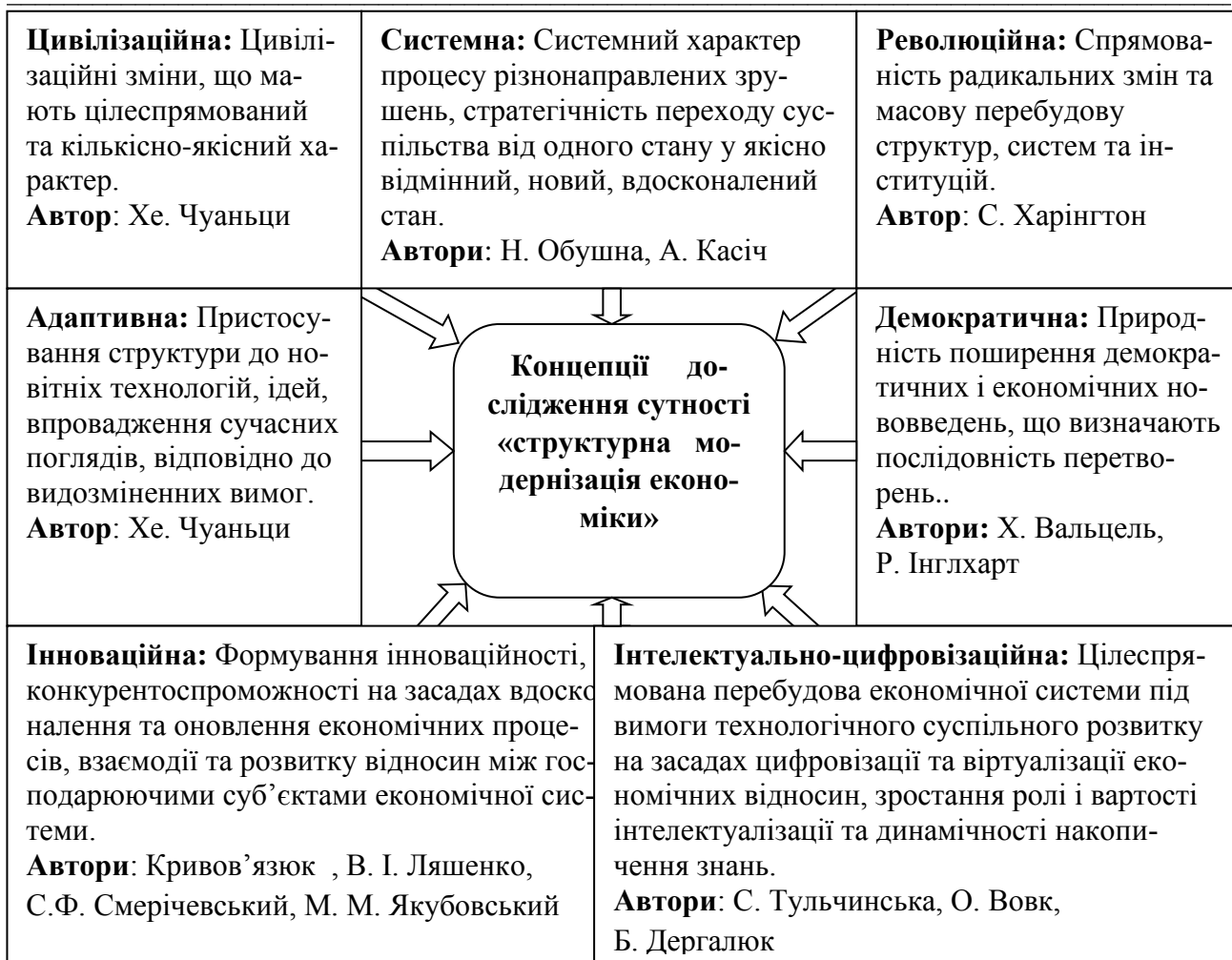
Рис. 2. Наукові концепції у трактуванні поняття «структурна модернізація» в економіці *узагальнено автором на основі [4-11, 13-14, 16-21]

З огляду на описані дослідження концепцій структурної модернізації економічних систем авторська позиція щодо трактування досліджуваної категорії в контексті управління національною економічною системою наступна: структурна модернізація – це цілеспрямований і узгоджений вплив на комплекс суспільно-економічних змін та відповідних структурних зрушень у структурі національної економіки, що забезпечує результативність економічного розвитку й ефективну адаптивність до прогресивних інновацій і змін в світовій економіці, стійкість до детенсивних впливів, стратегічність і комплексність економічних реформ.