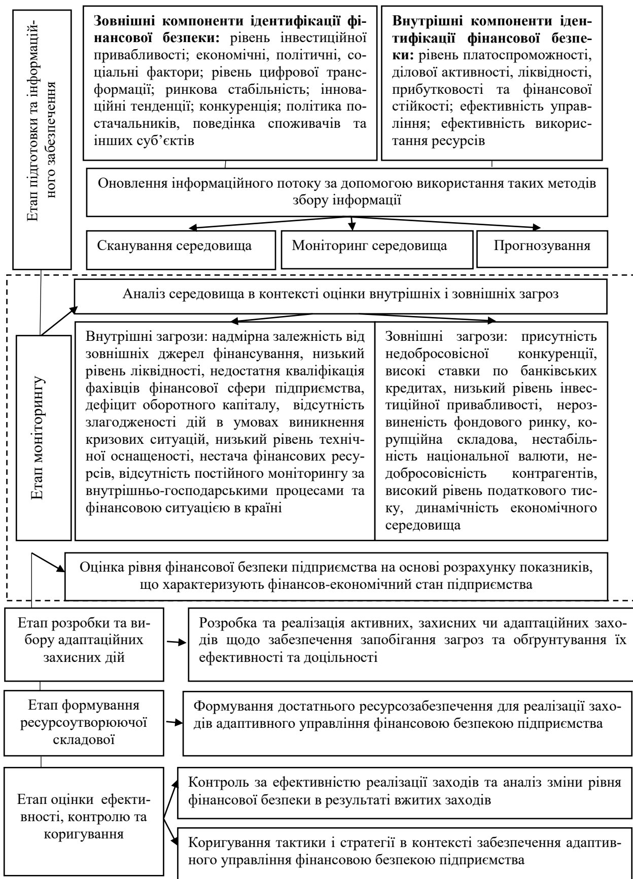
Рис. 2. Концептуальна схема забезпечення адаптивного управління фінансовою безпекою підприємства