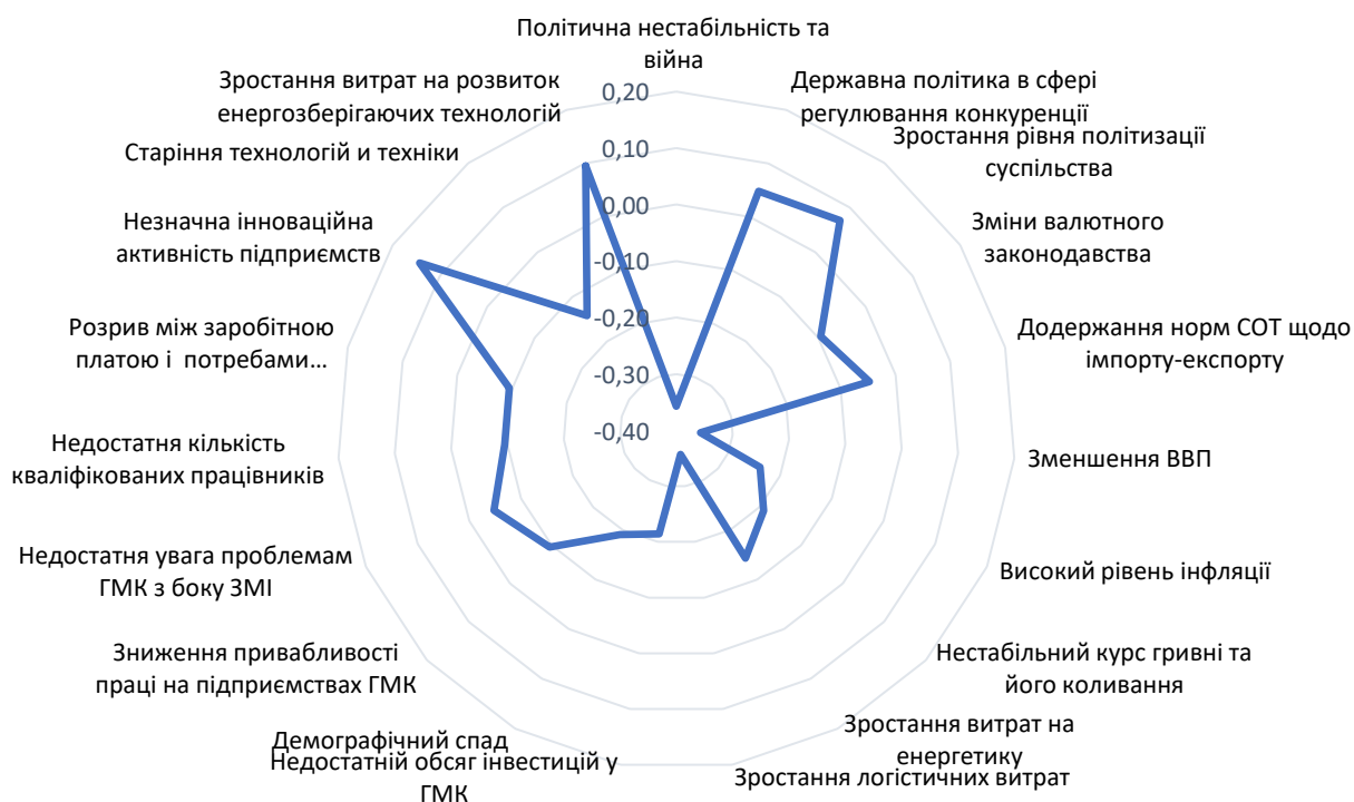
Рис. 2. Пелюсткова діаграма PEST-аналізу впливу чинників ризику на діяльність підприємств ГМК в Україні

Для розвитку енергозберігаючих технологій потрібно фінансування інноваційних проєктів з модернізацією обладнання, що гальмується через повномасштабні воєнні дії.