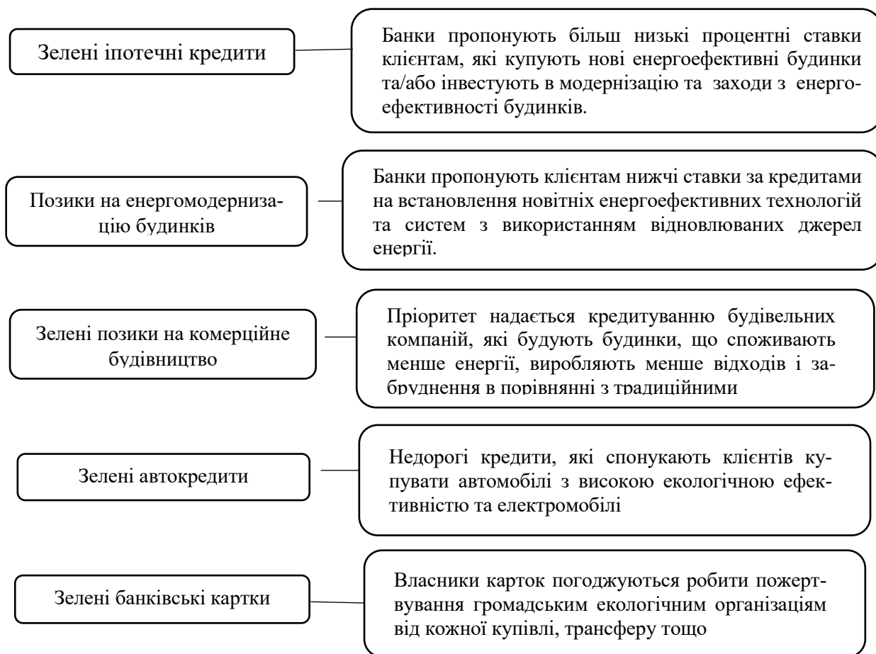
Рис. 2. Банківські фінансові інструменти, які можна впроваджувати в «зеленому» банкінгу України [13]

України, серед яких доцільно виділити наступні (рис. 2)