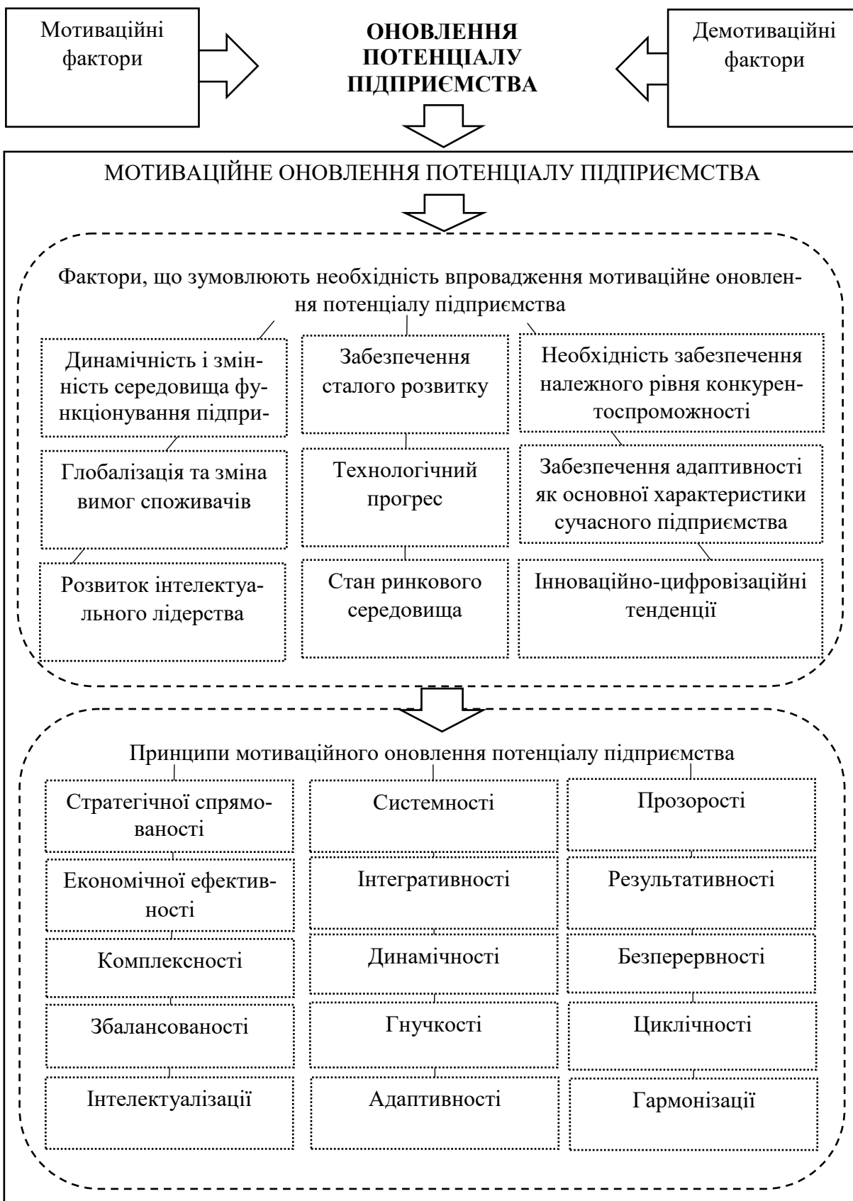
Рис. 2. Мотиваційні аспекти оновлення потенціалу підприємства

Виходячи із цього мотиваційні аспекти для проведення оновлення потенціалу підприємства можуть стосуватись наступного: