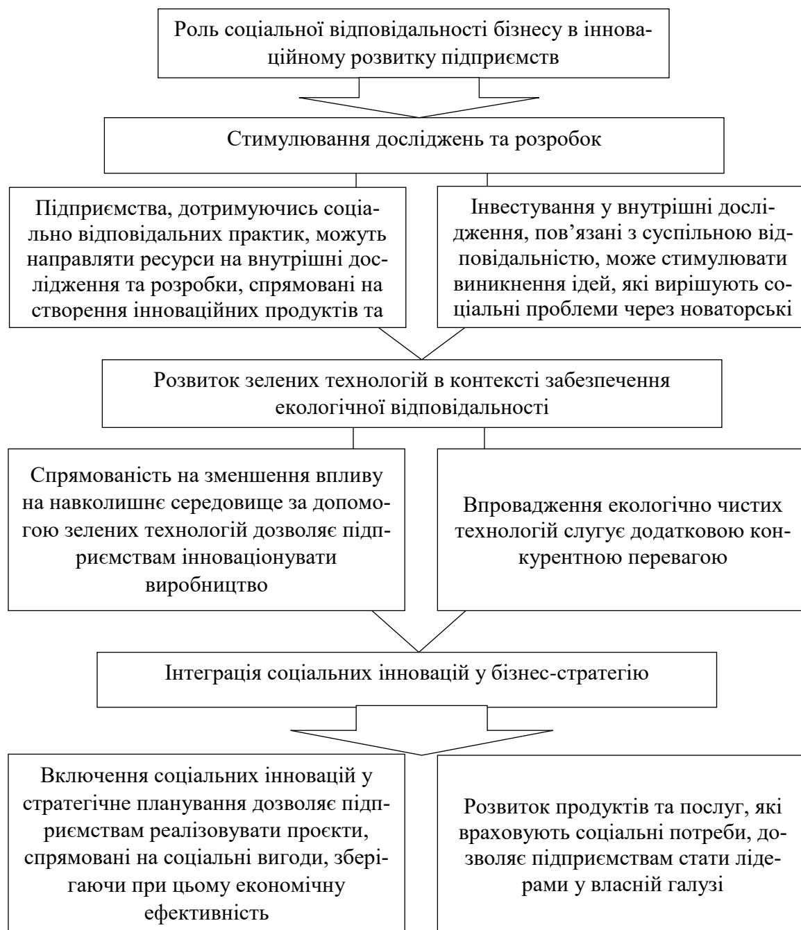
Рис. 3. Цільові компоненти, що визначають роль соціальної відповідальності бізнесу в інноваційному розвитку підприємств

ході до розв'язання суспільних проблем. Взаємодія із зацікавленими сторонами, використання новітніх технологій та підтримка ініціатив сприяють створенню інноваційної екосистеми, що робить підприємство лідером у сталому розвитку.