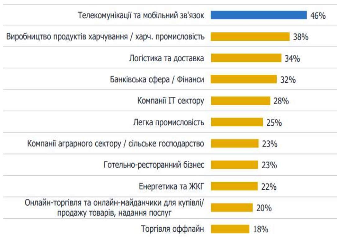
Рис. 2. Розподіл сфер українського бізнесу, які надають допомогу під час військових дій

Аналітичне дослідження соціальної відповідальності бізнесу в умовах війни, проведене FactumGroup, свідчить про згуртованість всіх сфер бізнесу в контексті підтримки соціальних ініціатив, які є досить актуальними на даний час (рис. 2).