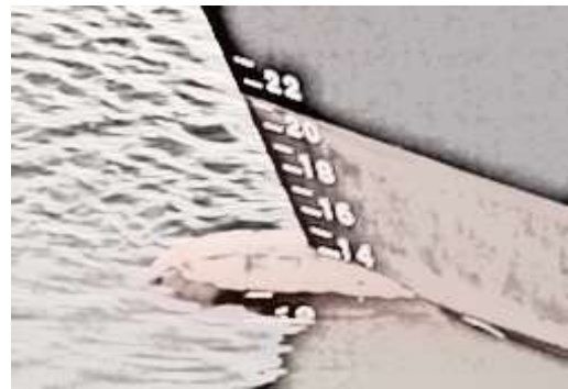
Рис. 3. Марки заглиблення корабля на його міделі [9]

Вага завантаженого товару на корабель визначається за величиною заглиблення корабля після закінчення завантаження. На рис. 3 показано борт корабля з рисками, за якими визначається це заглиблення.