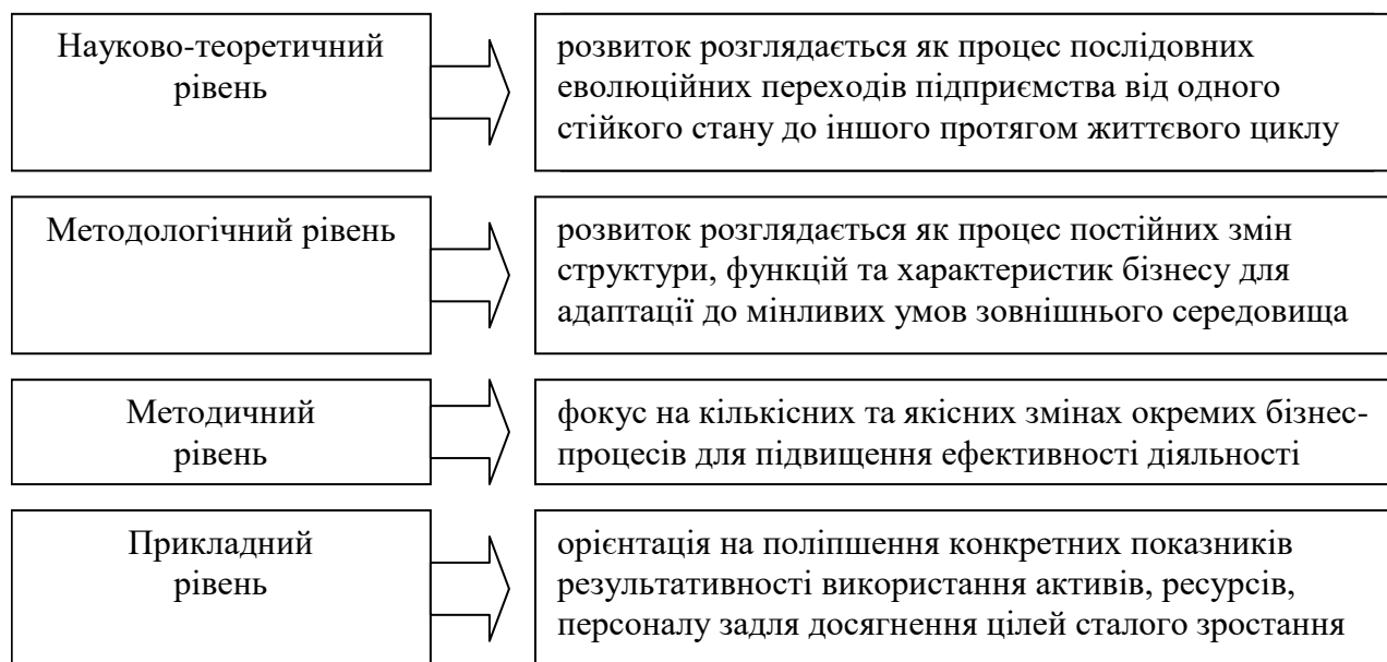
Рис.1. Рівні розгляду поняття «розвиток»

Формуючі концептуальні основи визначення сталого розвитку, доцільним буде виділення 4 можливих рівня вивчення розвитку підприємств, що вказані на рис.1.