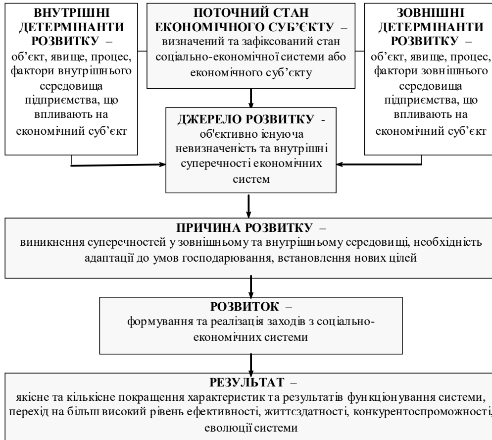
Рис.3. Структурно-логічна схема процесу розвитку

– синергія (підвищення ефективності в результаті взаємодії з іншими системами, між елементами підсистем, в результаті якої виникають емерджентні властивості, тобто властивості, що не притаманні окремими елементам системи, і виникають тільки при взаємодії її елементів між собою).