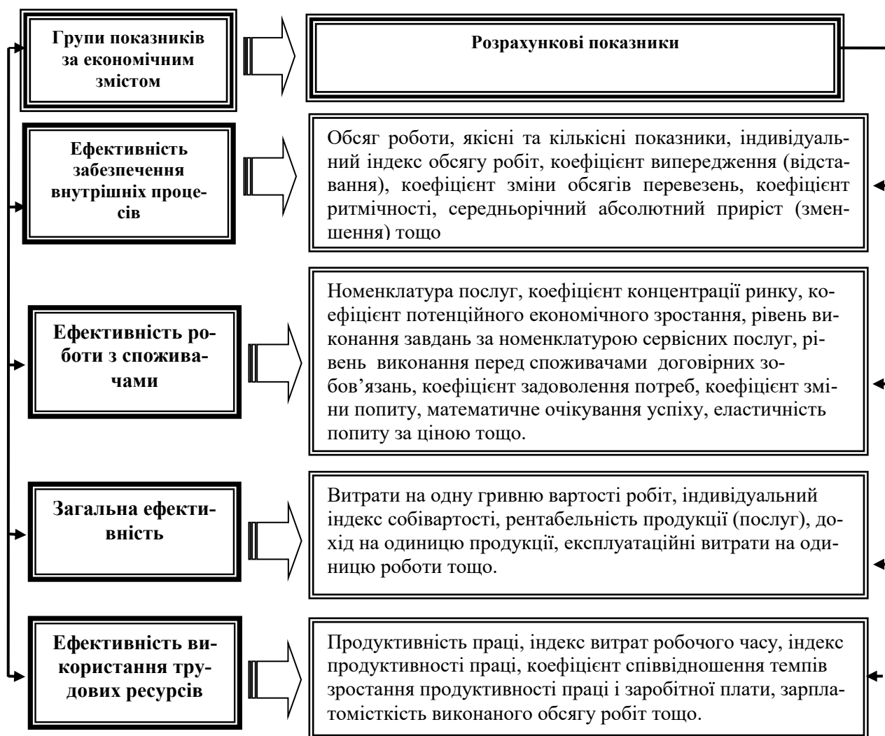
Рис. 2. Показники збалансованої системи показників оцінки інноваційного потенціалу

ресурсів», що дозволяють провести оцінку персоналу підприємства, тобто їх рівень кваліфікації, продуктивність, мотивацію тощо.