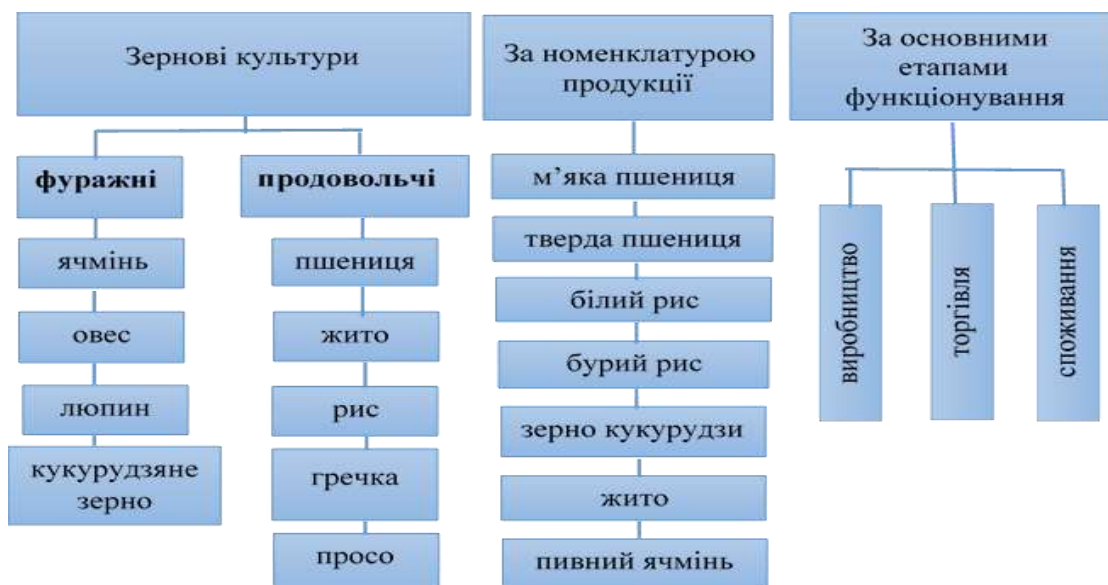
Рис. 1. Структурування світового ринку зерна за трьома класифікаційними ознаками*

власне розуміння сутності світового ринку зерна, ми його трактуємо, як глобальну систему обміну та торгівлі різними видами зернових культур (такими як пшениця, кукурудза, рис, ячмінь, овес тощо) на якому країни-виробники продають свої врожаї, а країни-споживачі купують зерно для власного споживання або використання у виробництві. Для характеристики ринку доречно виокремити структуру цього ринку. В науковій та аналітичній літературі є різні підходи [2,8,10,14] до розуміння структури світового ринку зерна. Найбільш розповсюдженою є наступна класифікація структури: по-перше, виокремлюють продовольчі та фуражні зернові культури; по-друге, класифікують за номенклатурою продукції яка включає різноманітні види зернових культур та їх продуктів; по-третє, за основними етапами функціонування ринку (виробництво, торгівля, споживання). Види структури зернового ринку наглядно демонструє рисунок 1.