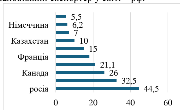
Рис. 3. Рейтинг країн-експортерів пшениці в 2022–2023, млн т*

Для аналізу тенденцій на світовому ринку зерна з точки зору експорту та країн-експортерів зупинимось на прикладі пшениці. У 2022–2023 маркетинговому році сумарний обсяг експорту пшениці на світовому ринку склав 212,9 млн т [16], що є рекордним показником. В п'ятірку найбільших країн експортерів входять росія – 44,5 млн т, Австралія – 32,5 млн т, Канада – 26 млн т, США – 21,1 млн т, Франція – 18 млн т. Частка України у світовому експорті склала 7% – цілком гідний показник і шосте місце у світі (рис. 3). При цьому п'ятірка найбільших країн-експортерів пшениці залишилася незмінною, як і найбільший експортер у світі – рф.