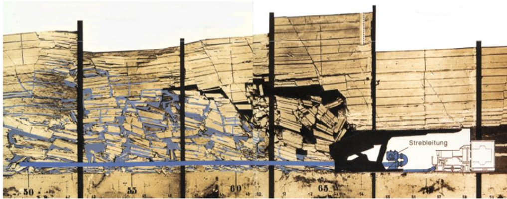
Рис. 1. Ілюстрація варіації висоти обвалень покрівлі пласта згідно Langosh і Ruppel [6]

Практика застосування розробленої моделі підтвердила її надійність і достовірність результатів моделювання завдяки тому, що залежності (2-4) створюють зворотний зв'язок між висотою руйнування покрівлі й ефектом самопідбутівки порід. Чим менше підбутівка, тим більше осідання покрівлі і вище рівень діючих напружень, що сприяє процесу руйнування покрівлі (залежності 2-3). У результаті ж її руйнування збільшується жорсткість підшви плити (рівняння 4), що зменшує осідання й напруження. Тому виникає затримка обвалення, протягом якої очисний вибій відходить на певну відстань і таким чином формується крок обвалення основної покрівлі. Отже формули (2-4) створюють зворотний зв'язок, який сприяє виникненню складного автоколивального процесу, що формує певну картину обвалення покрівлі й відповідну динаміку гірського тиску навколо діючої лави. Оскільки межа міцності порід залежить від швидкості їх навантаження, створюються можливості моделювати швидкість посування лави.