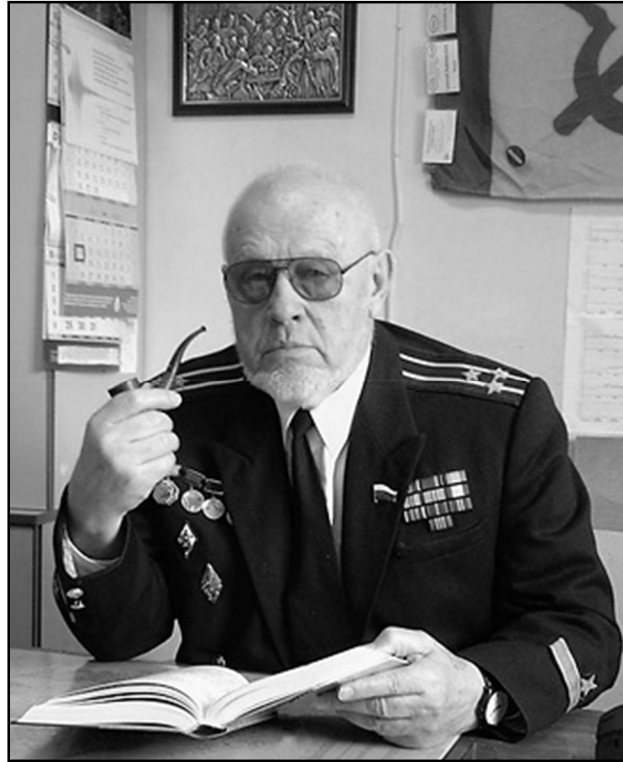
ЛЕОНІД ЄВГЕНОВИЧ СОБІСЕВИЧ

5 грудня 2020 року відійшов у вічність доктор технічних наук, професор, головний науковий співробітник лабораторії прикладної геофізики і вулканології Інституту фізики Землі імені О.Ю. Шмідта Російської академії наук, уродженець України