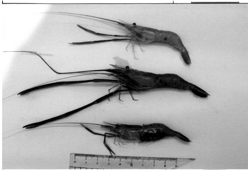
2. Экземпляры креветки Macrobrachium nipponense (июль 2013 г., Днестровский лиман).