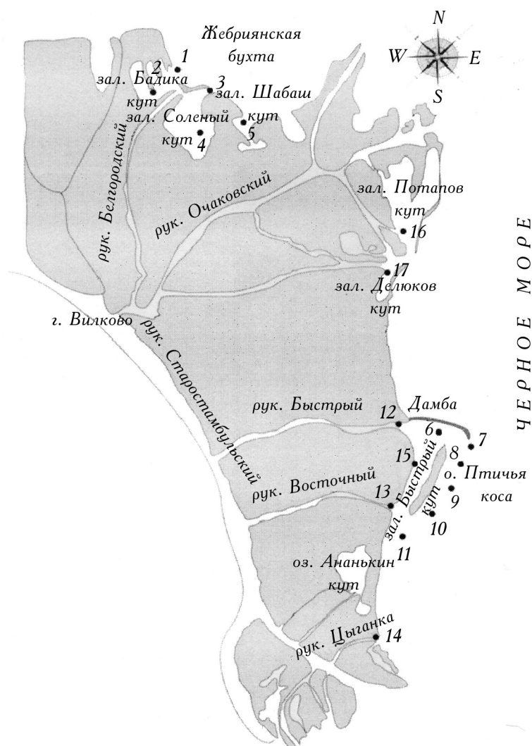
1. Карта-схема отбора проб: ст. 1, 2 — зал. Бадика кут, ст. 3, 4 — зал. Солёный кут, ст. 5 — зал. Шабаш кут, ст. 6 — ПК ГСХ, ст. 7 — море у шпильи дамбы ПК ГСХ, ст. 8 — море напротив о. Птичья коса (от рук. Быстрый), ст. 9 — море напротив о. Птичья коса (середина), ст. 10 — море напротив о. Птичья коса (от рук. Восточный), ст. 11 — мелководья между рук. Восточный и Цыганка, ст. 12 — устье рук. Быстрый, ст. 13 — устье рук. Восточный, ст. 14 — устье рук. Цыганка, ст. 15 — зал. Быстрый кут, ст. 16 — зал. Потапов кут, ст. 17 — зал. Делюков кут.

ет влияние моря, здесь понижение солёности отмечено в районе впадения Белгородского рукава в заливах Солёный кут и Бадика кут. Восточное побережье, за исключением морской оконечности защитной дамбы ПК ГСХ, где зафиксирована максимальная солёность 12,64‰, наоборот, находится под преобладающим воздействием наиболее активных рукавов, которые существенно опресняют прибрежные акватории; тут доминируют олиго-мезогалинные воды, переходящие в рукавах в гипогалинные. Преимущественно пресные воды зафиксированы в опреснённых заливах Делюков кут и Потапов кут. На режим солёности приустьевого взморья и переднего края дель-