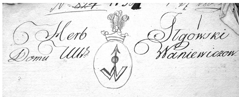
Герб Ілговський роду Ваневичів