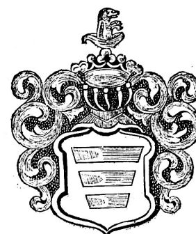
Герб Корчак у гербівнику Каспра Несецького "Korona polska"

дворянському депутатському зібранні. Вочевидь через це вони відкликали свої документи з Києва та подали їх до Житомира. Істотною була зміна в їхніх документах, що стосувалася саме герба. Відтак до Волинського дворянського депутатського зібрання потрапили вже документи, які вказували на належність цих Гурковських до герба Остоя 6 .