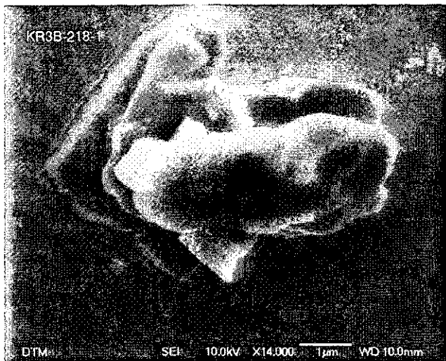
Рис. 2. Сканувальне електронномікроскопічне зображення досонячного зерна гібоніту, яке виділене хімічним методом із хондриту Крымка і діагностованого завдяки вимірюванням на йонному мікрзонді. Зерно розташоване на золотій пластинці.

щення про їх походження зі спільного досонячного джерела. Таким чином, можна констатувати, що в метеоритній колекції НАН України присутні метеорити, які, як носії досонячних зерен, є безцінним матеріалом для проведення сучасних досліджень в області мінералогії зірок.