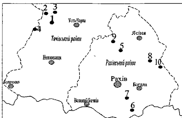
Рис. 1. Розташування місць відбору зразків снігу. Тячівський район, полонини: 1 – Виднога, 2 – Щавна, 3 – Щербан, 4 – Менчул. Рахівський район: 5 – полонина Драгобрат, 6 – г. Петрос Мармароський, 7 – полонина Менчул Квасівський, 8 – г. Петрос Черногірський, 9 – г. Близниці (Лазищі), 10 – г. Говерла.

Відбір зразків проведено на 10 ділянках, за методом конверту, тобто 1 ділянка – 5 зразків снігу, з різних висотних поясів (висота від 1050 до 2020 м) у межах Рахівського та Тячівського районів Черногірської геоморфологічної області Карпат (табл. 1, рис. 1). Зразки 1–4 відібрано з території Тячівського району (Широколужанський масив), зразки 5–10 – з території Рахівського району (Черногірський масив).