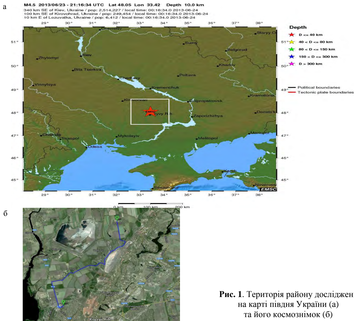
Рис. 1. Територія району досліджень на карті півдня України (а) та його космоснімок (б)

Дослідження виконувалися на основі існуючої на сьогодні унікальної інформації, яка міститься в записях сейсмічних коливань, зареєстрованих мережею сейсмічних станцій відділу сейсмічної небезпеки ІГФ НАН України і Центру спеціального контролю НКАУ.