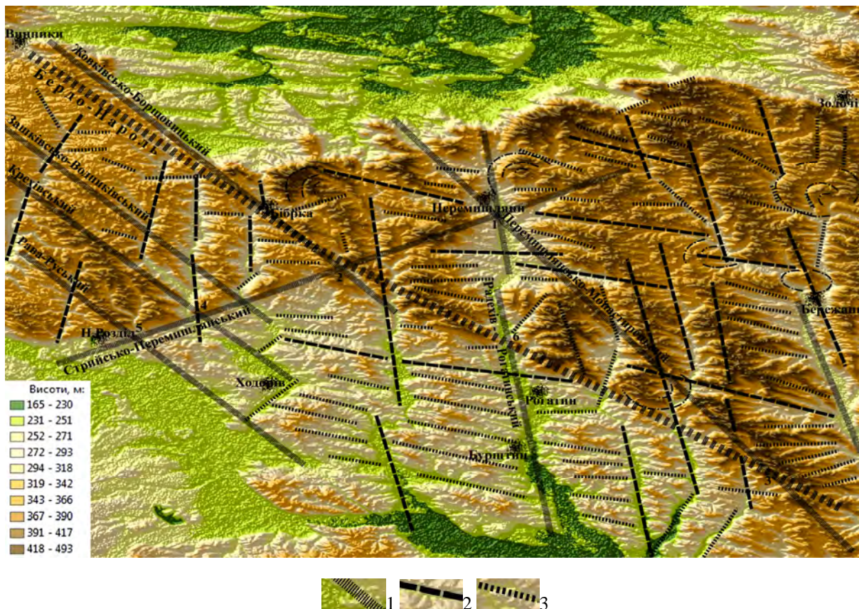
Рис. 1. Лінементи Опілля, виділені на 3d-моделі рельєфу. Масштаб 1:200 000: умовні позначення: 1 – лінементи 1-го порядку, що відповідають тектонічним лініям; оролінементи: 2 – 2-го порядку, 3 – 3-го порядку. Цифри 1–6 на рисунку – номери лінементних вузлі