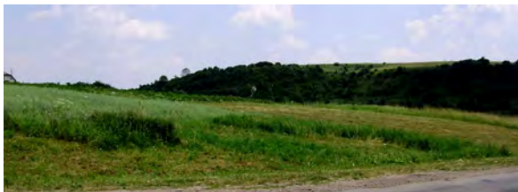
Рис. 3. Структурно зумовлений борт долини р. Свірж як індикатор тектонічного скиду (околиці с. Фрага Рогатинського району Івано-Франківської обл.)

Морфологічні особливості рельєфу, представлені на 3d-моделях, вказують також на кінематику розривів на Опілля [Гинтов О. Б., 2004]. Згідно з геоморфологічними ознаками виділення обстановок інтенсивного геодинамічного розтягу [Азімов О. Т., 2010], широкі долини лінійного простягання із крутими схилами, якими є долини рік Гнила Липа, Давидівка (с. В. Глібовичі), є індикаторами переважного розвитку напруг тектонічного розтягнення, тоді як вузькі долини, наприклад, як у рік Свірж, Суходілки (с. Ольховець), вказують на наявність зони стиснення (рис. 3).