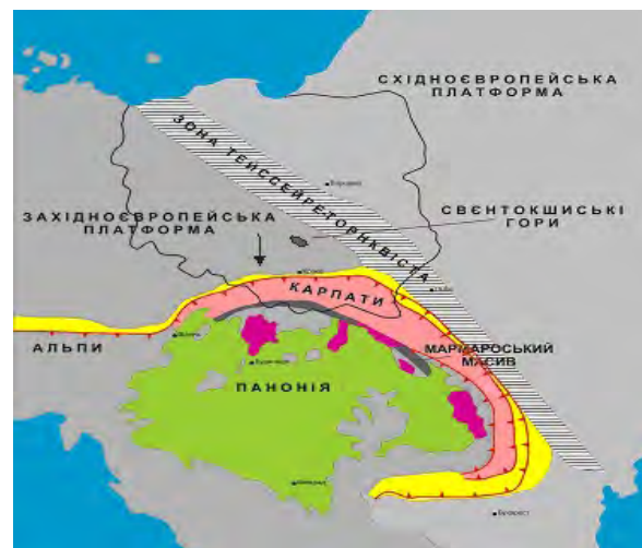
Рис. 1. Розташування Свентокшицьких гір у Польщі та Мармароського масиву в Україні та напрям стискувальних зусиль (↓) для Польських Карпат [М. Jarosinski, 1997]

Відносно першого регіону за даними гравіметричних досліджень і їх інтерпретації пояснили геодинамічні умови його формування, відповідно до теорії літосферних плит і наявності магматичних порід, як масив, зірваний зі свого субстрату і переміщений в останню фазу Карпатської складчастості до північного сходу [Ю. Крупський, В. Марусяк, 2011 р.]. Свентокшицькі гори в Польщі розташовані в межиріччі рік Вісли і Камінної. В Свентокшицьких горах на поверхні відслонюються відклади еокембрію, кембрію, силуру, девону, тріасу, юри, нижньої крейди. На південному сході й північному заході гори обрамляються відкладами молас міоцену, на північному сході й південному заході – відкладами юри і верхньої крейди польської низовини, яка прилягає до Краківсько-Сльонзького підняття.