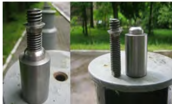
Рис. 4. Становий гвинт і гайка для примусового центрування інструментів і відбивачів на трубних знаках Fig. 4. Attachment screw and nut for forced centering of tools and reflectors totubular marks

Під час виконання наземних вимірювань одним з основних чинників, що лімітує реалізацію високої приладової точності, є вертикальна рефракція. Одним із найефективніших методів зменшення її впливу є спосіб одночасних двосторонніх спостережень [Дементьев В., 2009]. Застосування цього методу у просторовій мережі із багатьох пунктів є неможливим. Ми запропонували використання одночасних спостережень у певні періоди доби.