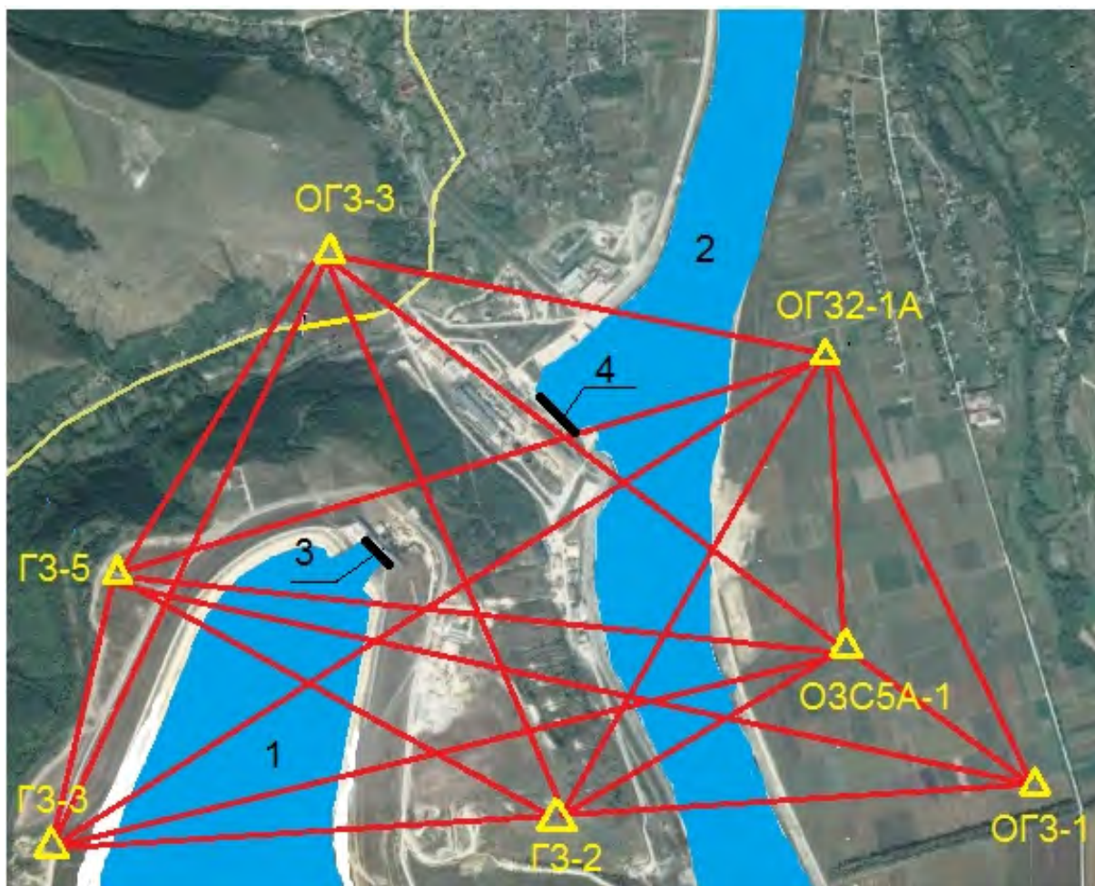
Рис. 1. Схема розташування пунктів каркасної геодезичної мережі і основних споруд Дністровської ГАЕС:

1 – верхнє водоймище; 2 – буферне руслове водоймище; 3 – водоприймач; 4 – водовипуск