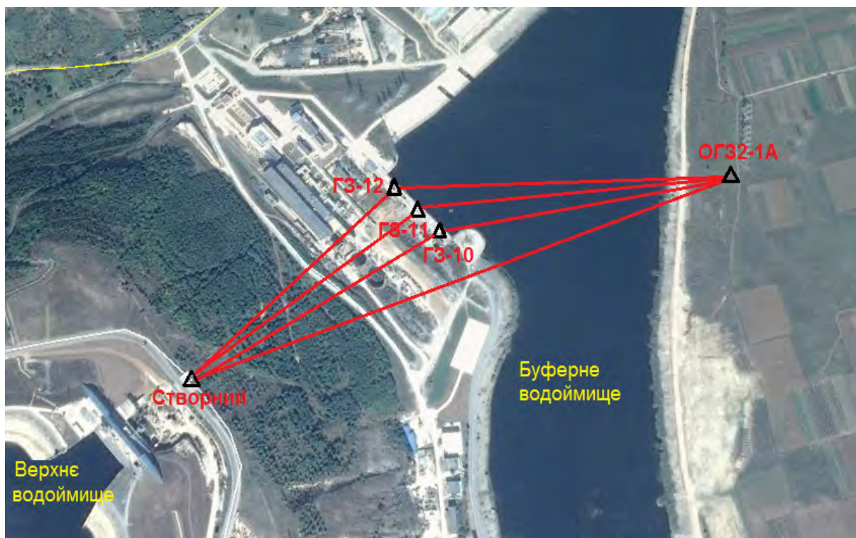
Рис. 3. Схема мережі лінійно-кутових вимірювань для визначення зміщень пунктів водовипуску Дністровської ГАЕС

Із табл. 3 видно, що с.к.п. планового положення вихідних пунктів не перевищує апіорної оцінки точності \pm 2 мм.