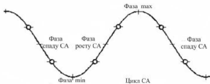
Рис. 1. Схема виділення чотирьох фаз в 11-річних циклах сонячної активності

Щоб визначити кількість подій, які потрапляють у кожен фазу циклу СА, ми зіставили по-