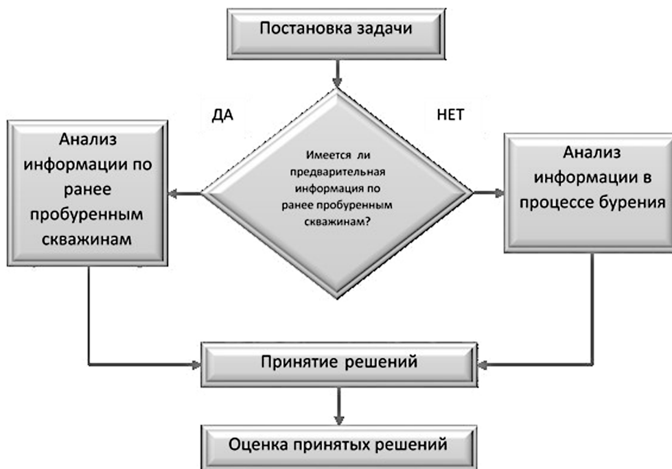
Рис. 1. Блок-схема принятия решений при бурении скважин в зависимости от характера исходной информации Fig. 1. A block diagram of decision-making during drilling, depending on the nature of the initial information